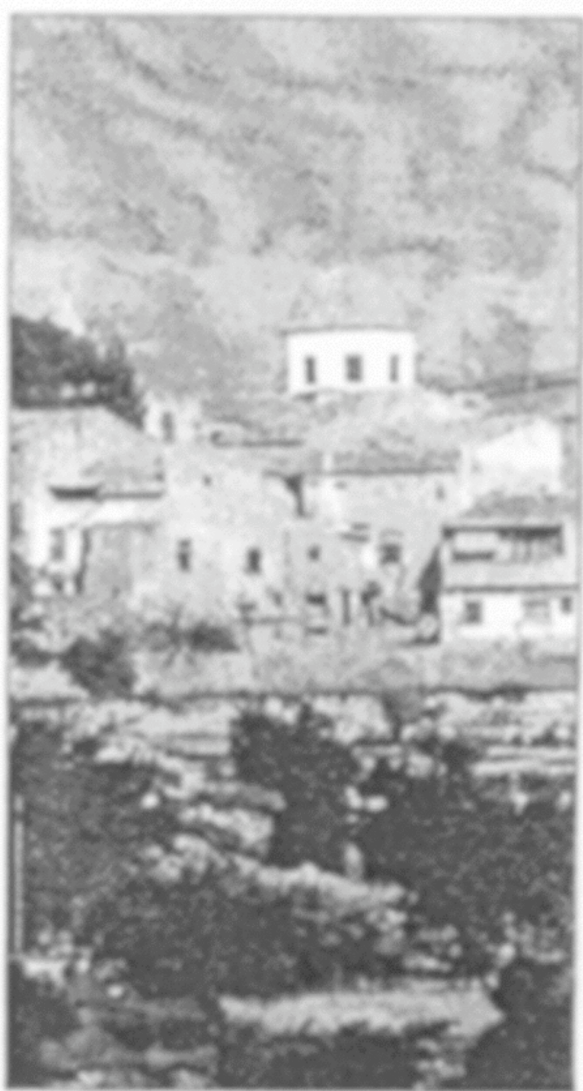
Iglesia de Aigües, en Alicante.

El Ayuntamiento de Aigües presentó una propuesta para el plan para la reforma de monu-